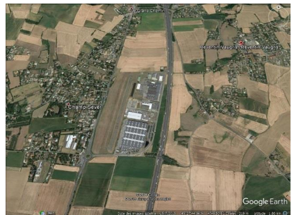
Espace de la solution Centre-compacte