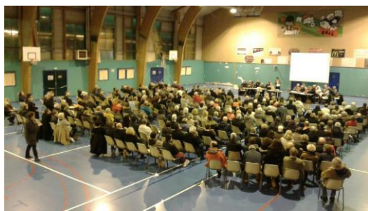
le 29 novembre 2018 au Gymnase