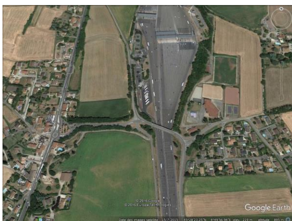
UN ROND POINT SUR UN LOTISSEMENT ? Une Aberration !

Aujourd'hui, votez les crédits pour l'échangeur, mais pas sur la variante Centre qui perturberait le principal axe de liaison de notre commune, passerait sur un lotissement et perturberait la zone de sports et loisirs de nos enfants.